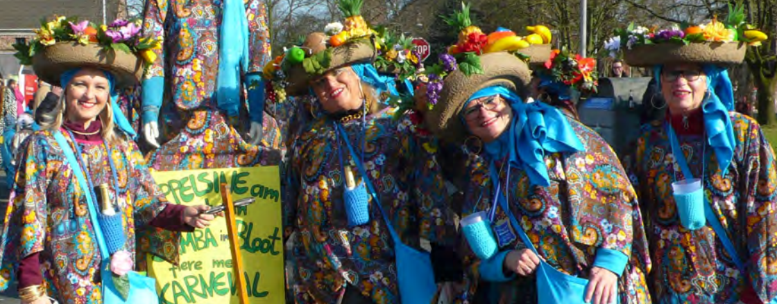
KG Echte Frönde feiert 11 Jahre - Narrenjubiläum