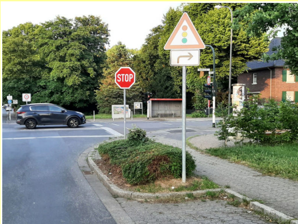
Neues Schild als Hinweis auf die Ampel! Die Bemühungen von Eltern und Bürgerverein führten doch noch zum Erfolg.